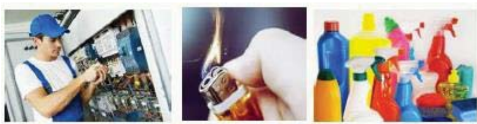
Fig. 10 Activități periculoase

-Evitarea efectuării unor activități periculoase (reparații, intervenții, suprasarcini la instalațiile echipamentelor, deplasare imprudentă, lucrul cu foc deschis, substanțe periculoase, aplecare peste geam, urcarea pe scări, scaune, poziționări greșite, altele) în timpul programului, așa cum se observă în figura 10.