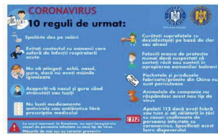
Fig. 13 Reguli COVID-19

-Asigurare masuri prevenire infectare cu SARS CoV2 Coronavirus 19, asa cum se observa in figura 13;