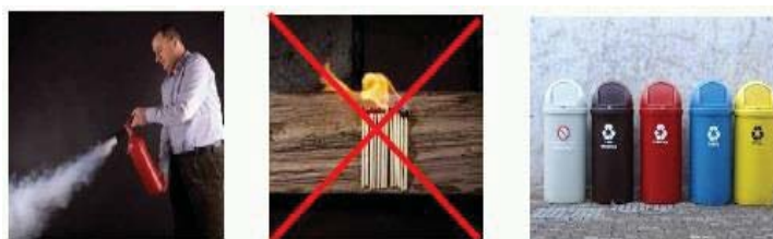
Fig. 12 Masuri de prevenire si protectie

-Asigurarea masurilor de prevenire si protectie in domeniul SU (situatiilor de urgenta) si protectia mediului, asa cum se observa in figura 12;