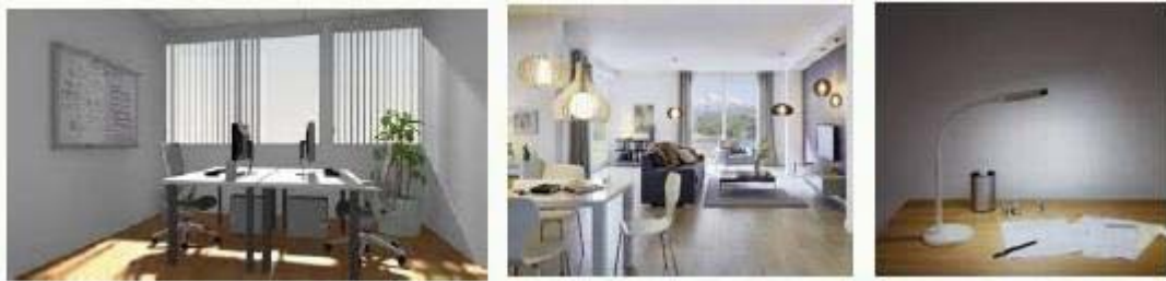
Fig. 4 Iluminare din tavan/lampa birou

-Electrosecuritate (tablou, instalatii, comutatoare, intreruptoare, echipamente electrice conforme, functionale, complete, securizate) asa cum se observa in figura 5;