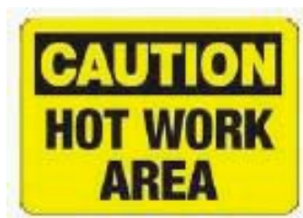
Fig. 2 Semnalizator zona de lucru