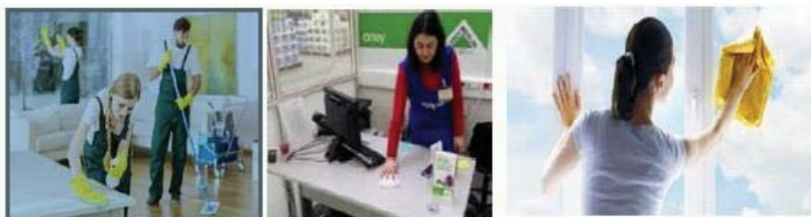
Fig. 8 Igiena si curatenie

-Igiena si curatenie (asigurare curatenie in zona de lucru), asa cum se observa in figura 8;