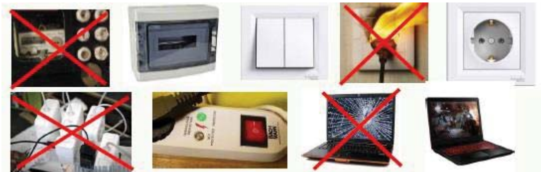
Fig. 5 Electrosecuritate

-Electrosecuritate (tablou, instalatii, comutatoare, intreruptoare, echipamente electrice conforme, functionale, complete, securizate) asa cum se observa in figura 5;