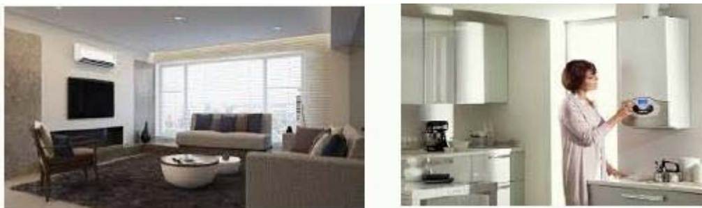
Fig. 6 Climat corespunzator

-Asigurare climat corespunzator in zona de lucru, asa cum se observa din figura 6;