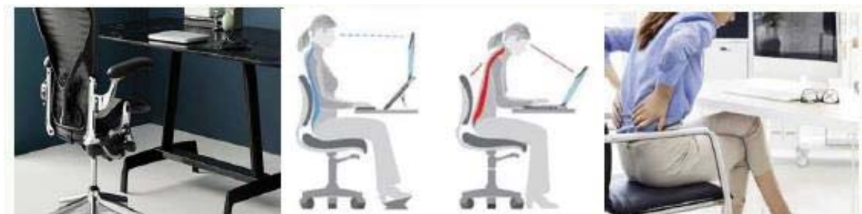
Fig. 7 Principii ergonomice

-Pozitia de lucru va fi la birou astfel incat sa respecte minim principiile ergonomice din instructiunile cunoscute din societate, asa cum se observa in figura 7;