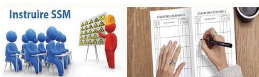
Fig. 9 Asigurarea informarii

-Asigurarea informarii, instruirii si comunicarii lucratorilor, asa cum se observa in figura 9;