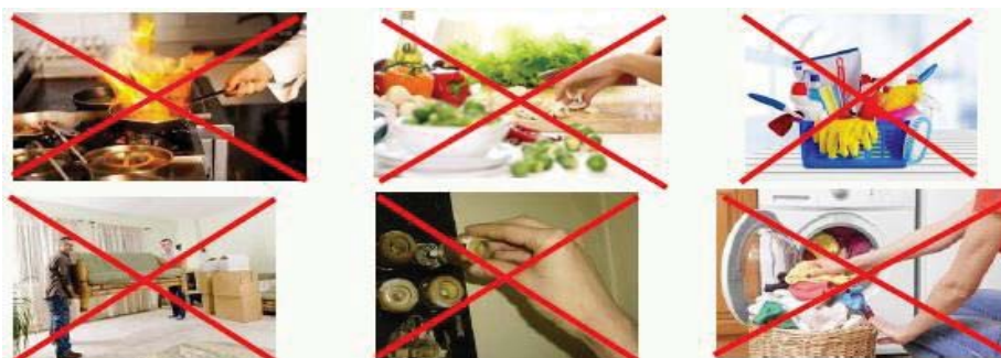
Fig. 11 Activități casnice

-Evitarea efectuării activităților casnice în timpul programului de lucru a unor activități periculoase (gătit, curățenie, mutări mobilier, înlocuire siguranțe, spălat), așa cum se observă în figura 11.