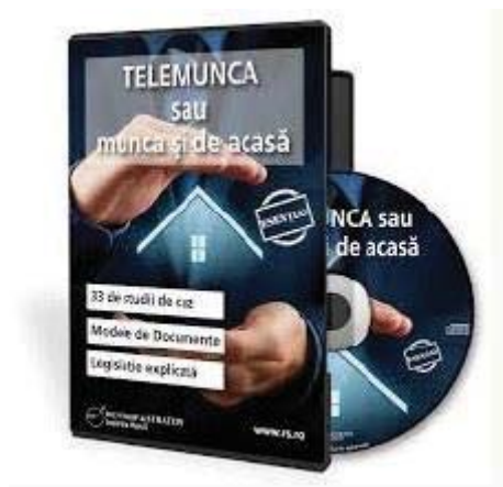
Fig. 1 Telemunca sau munca de acasa

Ca urmare a emiterii Decretului nr. 195/16.03.2020 privind instituirea stării de urgență pe teritoriul României, emis de președintele României pentru prevenirea răspândirii COVID-19 care prevede la art. 33 [7], “societățile cu capital privat, introduc, acolo unde este posibil, pe perioada stării de urgență, munca la domiciliu sau în regim de telemuncă, prin act unilateral al angajatorului” în cadrul societății se va modifica regimul de muncă și se va lua în calcul munca de acasă, așa cum se observă în figura 1.